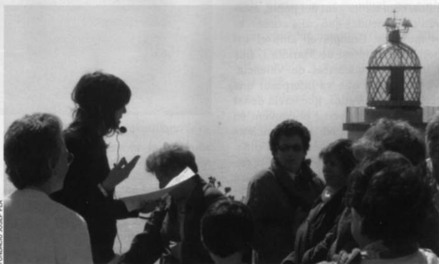
FUNDACIÓ JOSEP PLA

Basant-se en allò que es diu de Palafrugell al text d'una cançó satírica antiga i anònima sobre els pobles