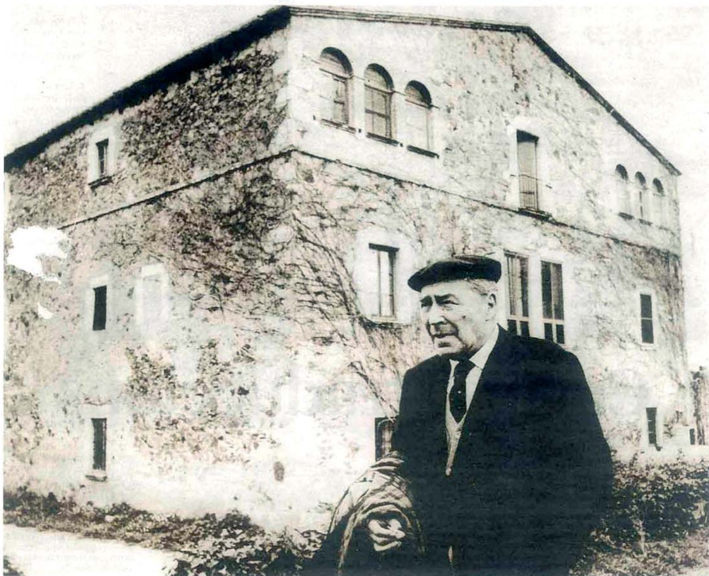
L'escriptor gironí Josep Pla, del qual se celebra aquest any el trenta aniversari de la seva mort, davant del Mas Pla a Llofriu (Baix Empordà)