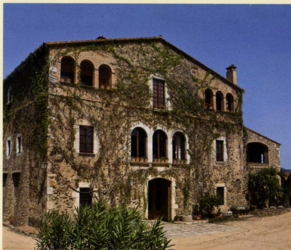
Maison de Josep Pla © Lliberth Salas

Josep Pla est né à Palafrugell en 1897 et il est mort à Llufríu en 1981. Chroniqueur, journaliste, romancier, il est devenu aujourd'hui une référence incontournable de la littérature catalane moderne et l'un des auteurs catalans les plus lus en Catalogne et au-delà. Le cahier gris , publié pour la première fois en 1966, après plusieurs réécritures, déjà traduit dans les principales langues européennes, ouvre le premier des quarante volumes de ses œuvres complètes.