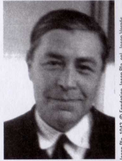
Josep Pla, 1942.

L'auteur est né à Palafrugell, en Catalogne, en 1897, au sein d'une famille de petits propriétaires terriens. Il abandonne ses études de médecine afin de poursuivre des études de droit. À l'issue de ses études, il commence à écrire pour plusieurs journaux locaux.