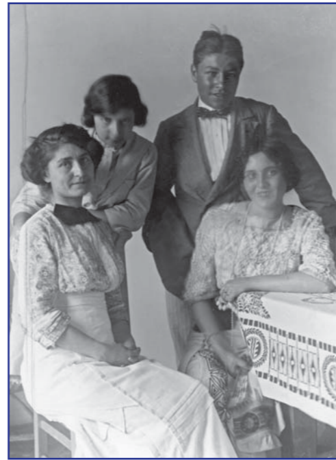
Caella, c. 1910 – Fotografia Baldomer Gili i Roig Museu d'Art Jaume Morera de Lleida (Llegat Dolores Moros)

Josep Pla. El meu poble dins El meu país , OC VII, p. 610