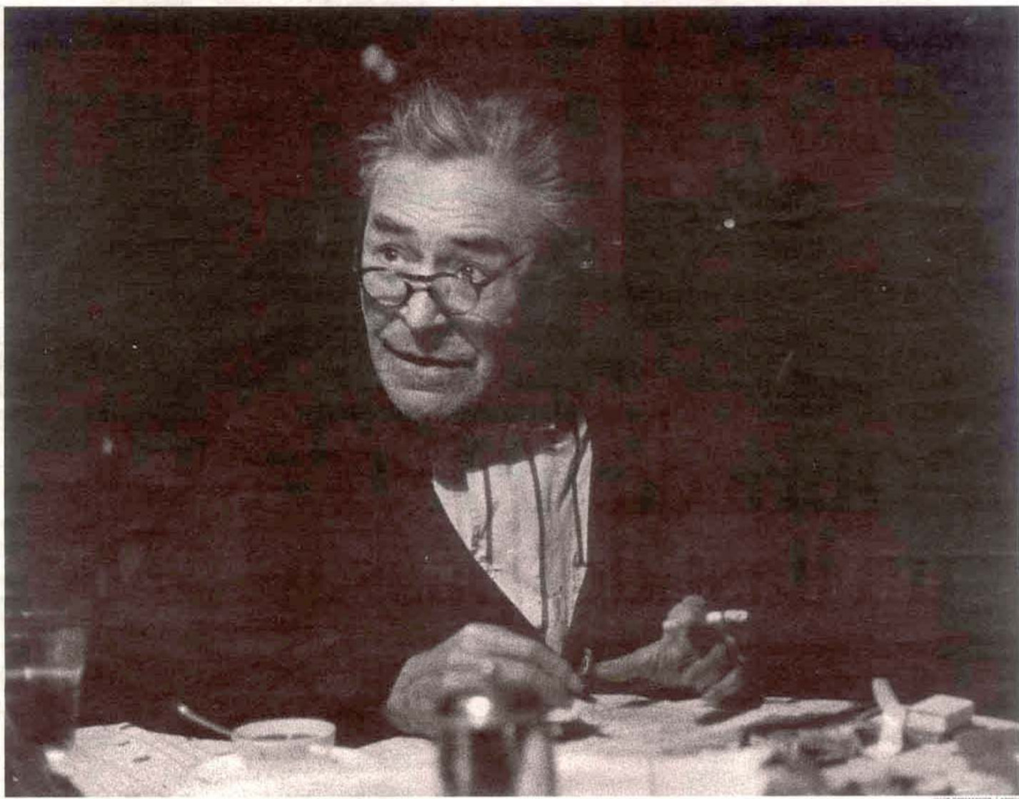
L'escriptor Josep Pla segueix sent un atractiu literari, tant per la seva extensa obra com per la seva persona