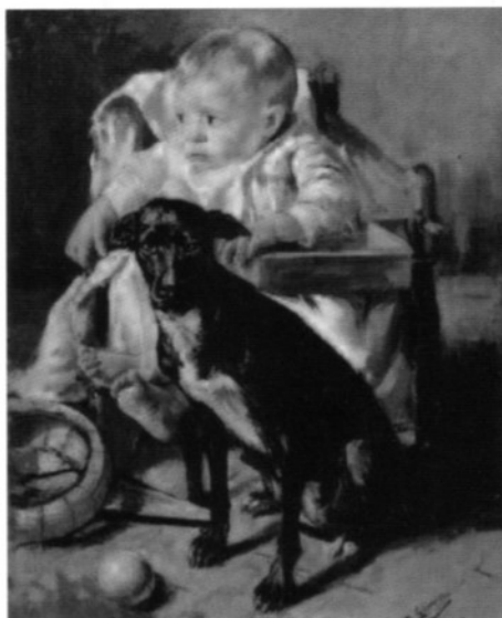
La petita i el seu companyó, Barcelona 1891

Tot i ser coetani de pintors modernistes com Santiago Rusiñol o Ramon Casas, la seva trajectòria independent, l'ofici de "pintor de parets" que li atribueix Josep Pla en l'Homemot corresponent referint-se a la jornada de treball que feia en una empresa, el va allunyar dels pintors que freqüentaven Els Quatre Gats. En canvi diuen que se'l podia veure a Can Parés els diumenges al matí, quan els burgesos en sortir de missa anaven a veure l'exposició, vestit de pana amb el rellotge penjant d'un cordill i el cabàs ple de pinzells a l'esquena.