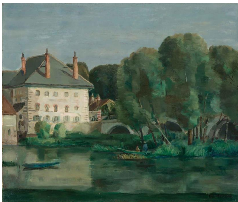
Lluís Mercadé, Moret-sur-Loing , cap a 1924. Oli sobre tela, 46 x 55 cm. Col·lecció particular.