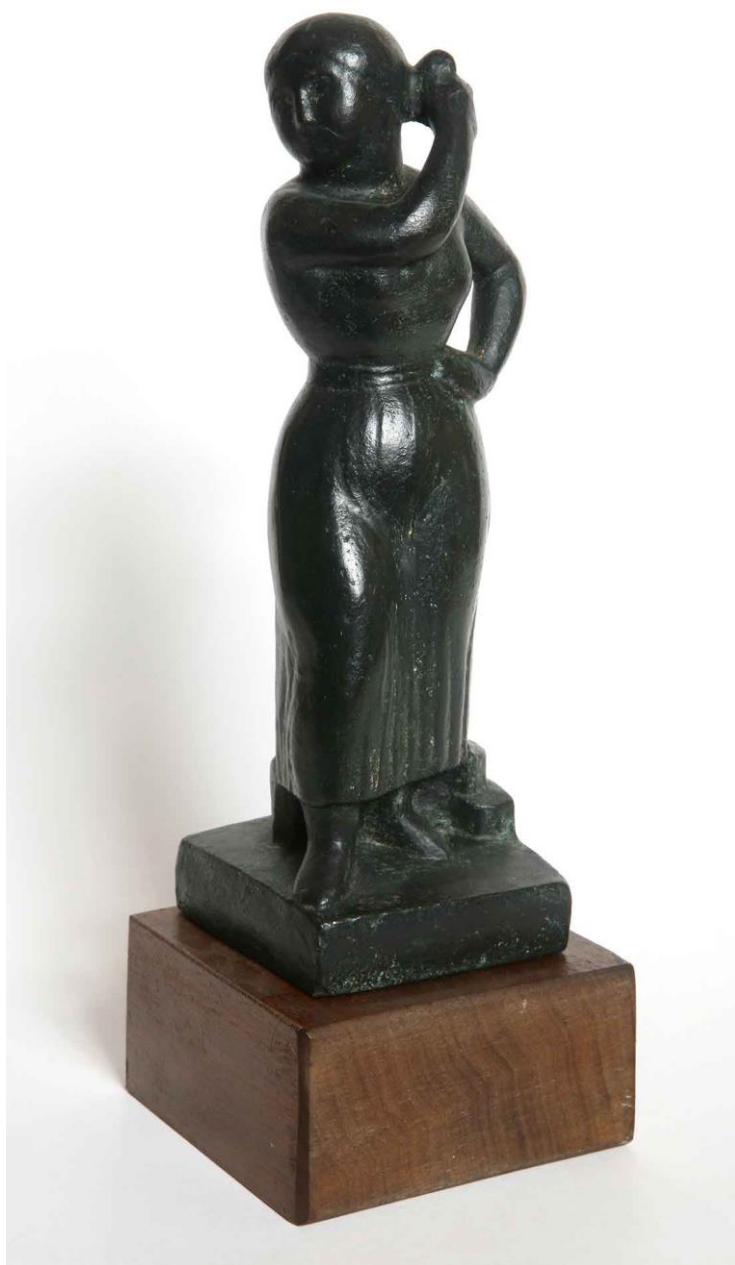
Manolo Hugué, Figura femenina , cap a 1920. Bronze, 18 x 6 x 6,5 cm. Museu Abelló. Mollet dels Vallès.

Quan tenia tret anys, m'agradava d'anar a l'altre de Palafrugell, La feta major del municipi és el de la fides, sande morganista, He' tavia entrant a plaça i' ballés en els dos grans casinos i ad. Roster. Dere ten furores per els dos Genis per embotís al federatisme de Pl. i. morganista