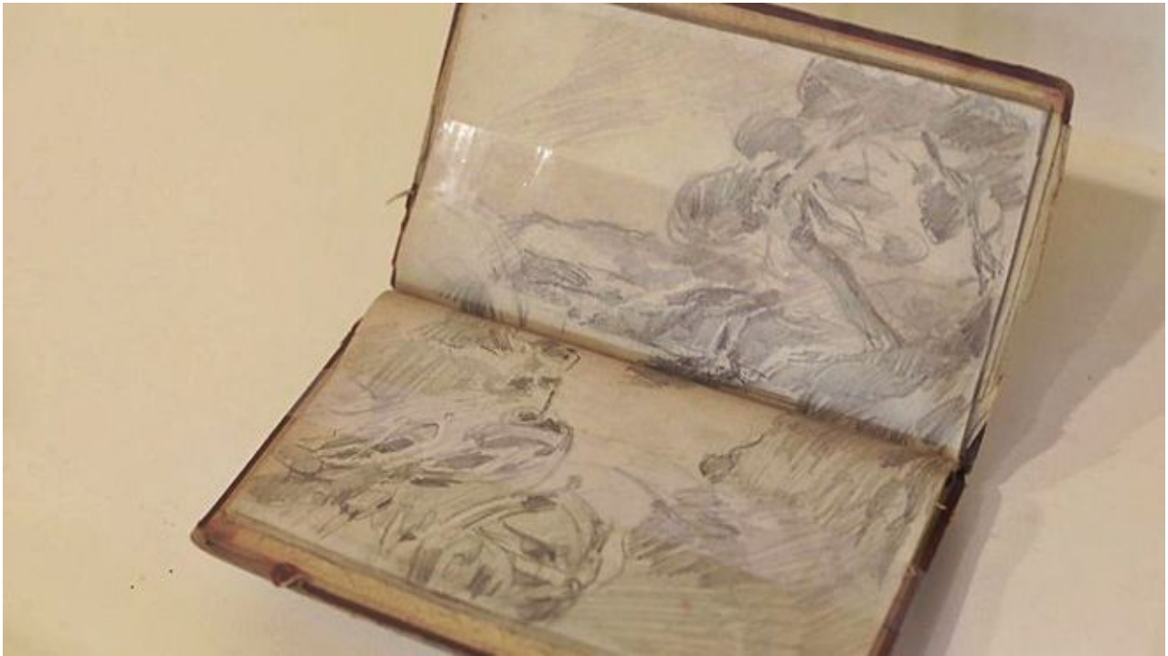
5 Moret-sur-Loing, 1924, Lluís Mercadé.