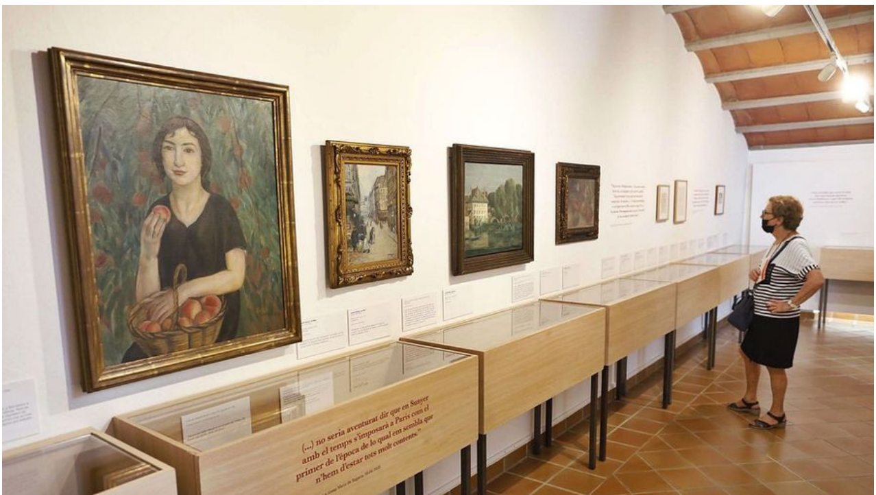
6 Una dona contemplant un bust de Josep Pla fet per Josep Dunyach, 1925.

El recull de dietaris, cartes, articles i molta altra documentació que Pla escrivia (o rebia) durant el seu dia a dia a París per a altres amics artistes que vivien a Catalunya o a altres ciutats europees com Berlín, s'ha convertit, amb el pas del temps, en una font d'informació valuosíssima per a qualsevol entusiasta de l'escriptor, ja que són peces literàries que recreen tot un puzzle de relacions, esdeveniments, descripcions i converses