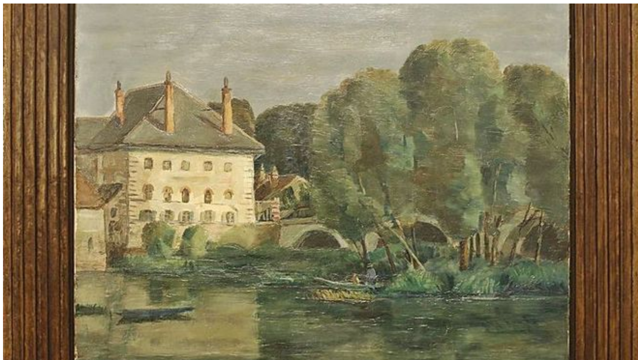
4 Calella, 1927, Ignasi Genover.F | ANIOL RESCLOSA

moment d'entreguerres, esdevenia l'epicentre d'un nou estil de vida marcat pel luxe i la vida nocturna que renaixia als bistrot. Començava la Belle Époque, marcada per una bohèmia magnètica que convidava a tots els artistes internacionals a apropar-se a la que en deien cité de l'amour.