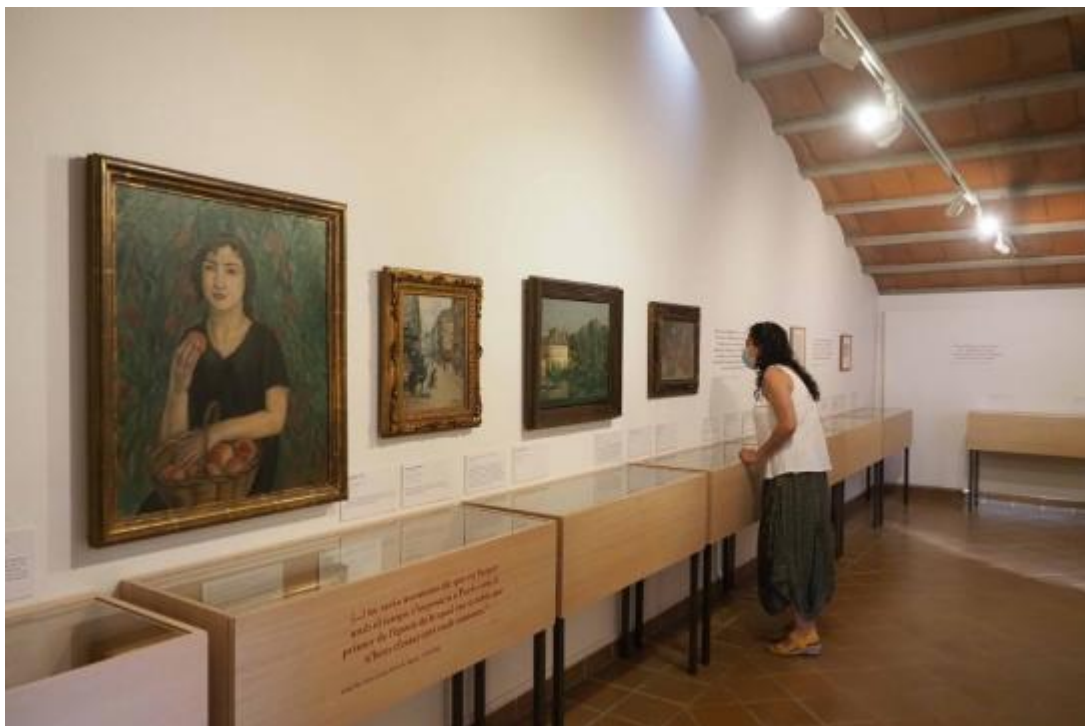
La muestra reúne varias obras originales de los autores más relevantes del momento. En la imagen, en primer término, La nena dels préssecs (1921) de Joaquim Sunyer

La exposición reúne correspondencia que se intercambiaron Pla y Plana sobre un estudio dedicado a Enric Casanovas. “... procuro imitar en todo lo que puedo tu manera de escribir. (Ej. “un cielo lluvioso que mastica la niebla”. Me parece que quedarás contento”, escribió Plana en una de las cartas.