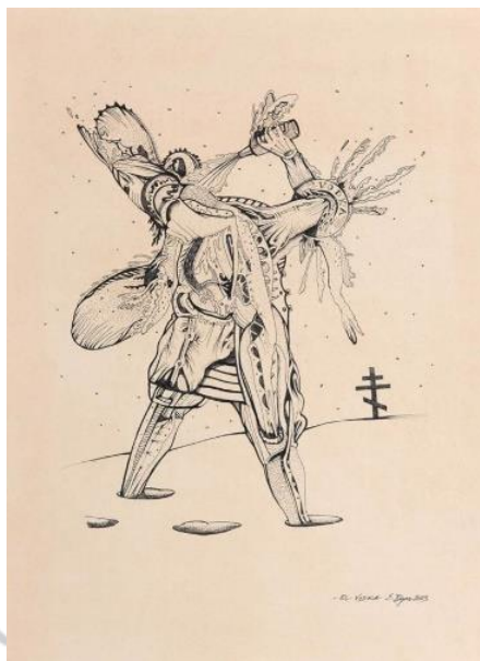
El vodka. Eduard Bigas, 2023. Tinta, te i aquarel·la sobre paper. 41 x 31 cm

Josep Pla, “Fase de descomposició”, La Publicitat , 21/08/1923