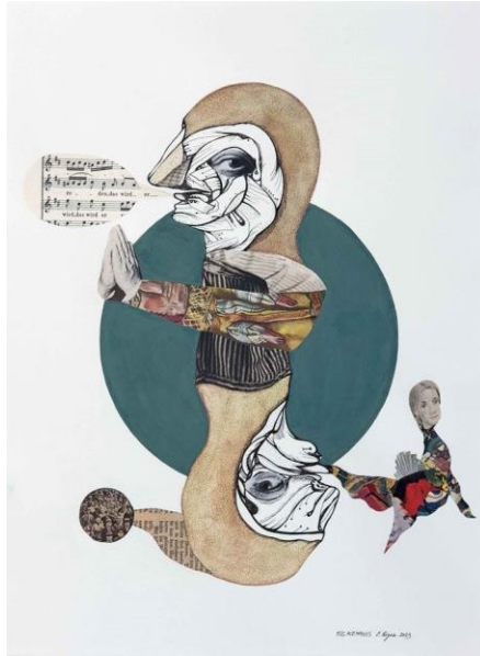
“Els Alemanys”. Eduard Bigas, 2023. Tinta, te, collage, aquarel·la i gouache sobre paper

“El crac alemany és una lletra a la vista. En pocs dies la inflació ha destruït cent anys d'ordre i d'autoritat prussiana. Si la inflació continua, com no pot sinó continuar, si la resistència persisteix, això se'n va a rodar.”